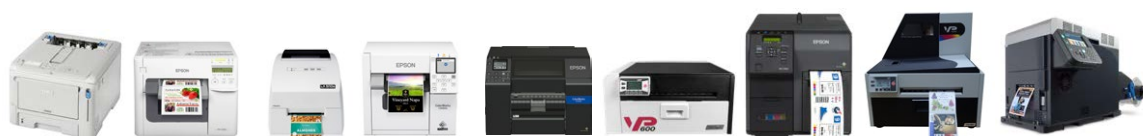
OKI C650dn Epson C3500 Primera LX500e/ LX500ec Epson C4000 BK/ C4000 MK Epson C6000/ C6500 VIPColor VP600/ VP650 Epson C7500/ C7500G VIPColor VP700/ VP750 OKI Pro 1040/ 1050